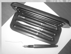
PARURE DE STYLO 15 €