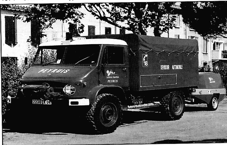
1971 - UNIMOG 404 Type M180 -11u 10cv Moteur Ess. CS de Peyruis (04)