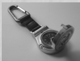
MONTRES 20 €