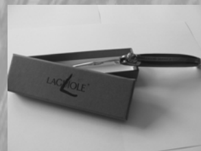
COUTEAU DE LAGUIOLE 35 €