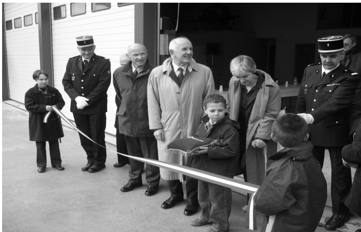
Cette présentation de l'inauguration a été faite par l'amicale de Montbazens

Les Sapeurs Pompiers de Montbazens, remercient toutes les personnes ayant participé à cette réalisation.